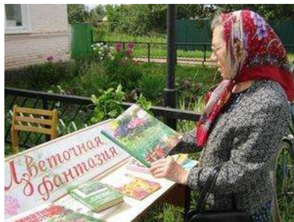
Библиотечный уличный флешмоб под названием «Мы, книги и цветы»