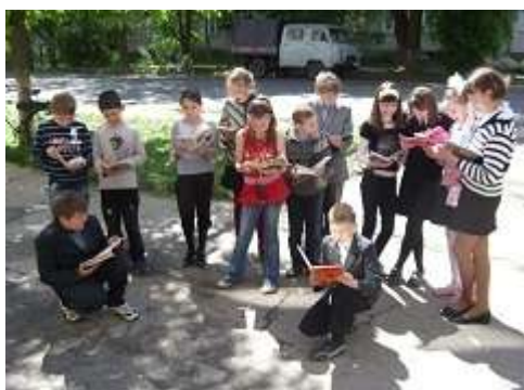
Флешмоб «Любимая книга» // http://www.chtenie-21.ru/news/5802

И в завершении вопроса о флэш-мобе предлагаем несколько веб-адресов и для примера посмотрим фотографии, представляющих варианты флэш-моба в библиотеки, все взято из Интернет вместе с адресами.