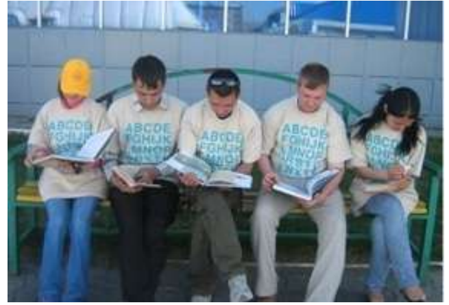
Пример социо-моба проведен в библиотеке Карагандинской ЦБС

Акция флэш-моб «Прочти и передай другому» прошла в селе Агрогородок Абайской ЦБС и Балхашской ЦБС. Библиотечные работники, друзья библиотек в футболках и бейсболках с символикой неожиданно появлялись в многолюдных местах, вставая в круг, одновременно все открывали принесенные с собой книги и читали их в течение нескольких минут и так же неожиданно расходились. Прохожие обращали внимание на ее участников, и это было хорошим поводом предложить прохожим рекламки акции. В результате были разданы 32 из 40 подготовленных рекламок. В закладках рекламок были представлены списки книжных новинок, а также информация об услугах библиотеки, адреса, режиме работы, телефоны библиотеки, адреса сайтов библиотек Караганды и Карагандинской области.